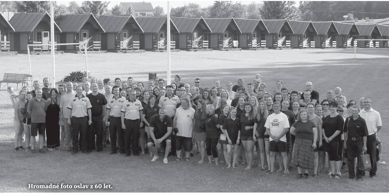
Hromadné foto oslav z 60 let.

let je důkazem toho, že LDT Jankov je místem, které může dětem poskytnout nezapomenutelné zážitky a umožnit jim smysluplně prožít nemalou část prázdnin v bezpečném prostředí mezi kamarády pod vedením zkušených výchovných pracovníků. Nelze než tomuto nádhernému místu, kterému mnozí obětovali nemalou část svých životů, společně popřát hodně štěstí do dalších let, osvědčené vedení Policie ČR a Správy logistického zabezpečení (SLZ PP ČR), které si je vědomo své odpovědnosti směrem k dětem policistů a za-