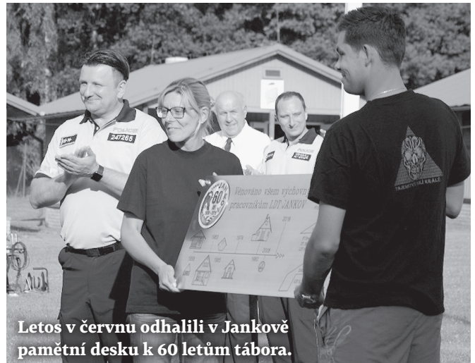
Letoš v červnu odhalili v Jankově pamětní desku k 60 letům tábora.

V této době patřil tábor Jankov k výběrovým zařízením pro rekreaci dětí zaměstnanců. Mnohdy tak nebylo vůbec jednoduché získat poukaz na letní pobyt. Jezdily sem děti doslova z celé republiky, pochopitelně včetně Slovenska, i když jich nebylo mnoho. Kromě toho tábor sloužil, i když