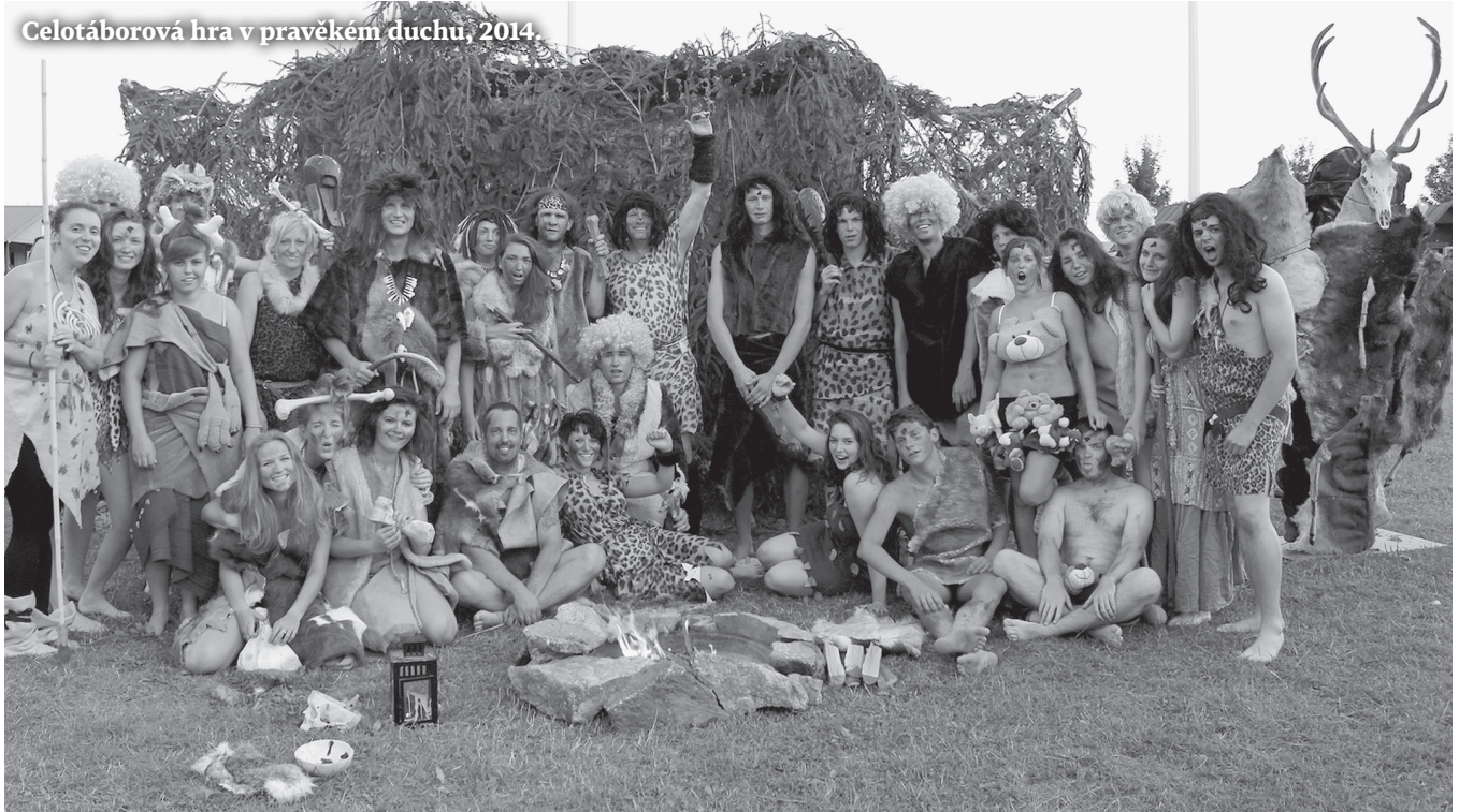
Celotáborová hra v pravěkém duchu, 2014.

Jako vedoucí jezdili do Jankova především zaměstnanci Federálního ministerstva vnitra, a to včetně lékařského personálu. Některé turnusy už v této době zavedly celotáborové hry a v rámci programu probíhalo množství sportovních a turistických aktivit, a to bez větší přítomnosti tehdejší ideologie.