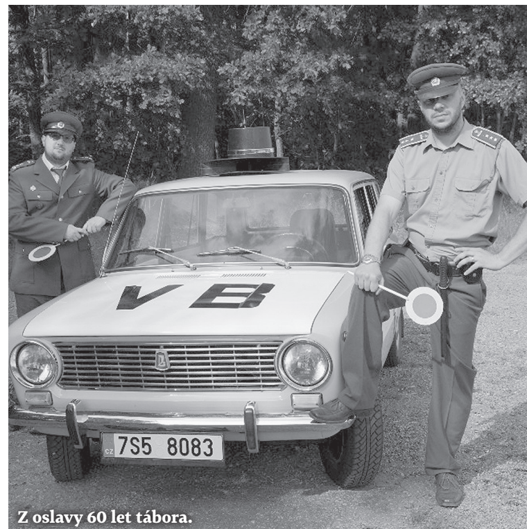
Z oslav 60 let tábora.