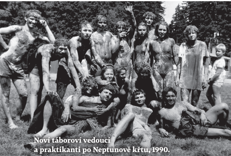
Noví táboroví vedoucí a praktikanti po Neptunově křtu, 1990.

Rok 1965 byl pro tábor přelomový, skončilo totiž „stanové městečko“ a místo něho vyrostly v Jankově unifikované chatky (též známé jako „teletníky“). To byla na tehdejší dobu velká novinka, která výrazně změnila kapacitu tábora a komfort ubytování.