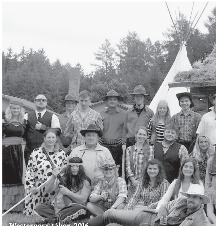
Westernový tábor, 2016.